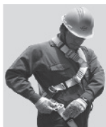
3. Abroche las hebillas que cuelgan a la altura de las piernas y proceda a regular.