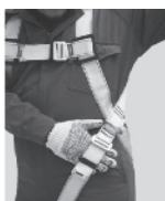
3. Regule todas las hebillas de tal forma que quepa una mano apretada entre la ropa y las correas.