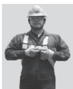
1. Abroche la hebilla que queda a la altura del pecho.