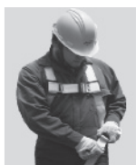
2. Abroche las correas que cuelgan a la altura de las piernas.