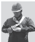
2. Abroche la hebilla que está a la altura de la cadera.