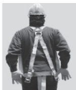
3. Colóquese el arnés como si fuera un chaleco; la anilla "D" debe quedar en la espalda y al centro de los hombros.