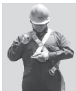
1. Abroche la hebilla que queda a la altura del pecho.