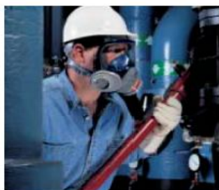
Configuración de dos puertos con combinación de cartuchos.

Su diseño se basó en medidas de características faciales de más de 8,000 personas.