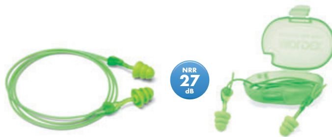
6445 Glide Trio Triple Pestaña Tapones Auditivos Reutilizables

PRECAUCIÓN: No apriete ni gire al limpiar las pestañas del Glide Trio.