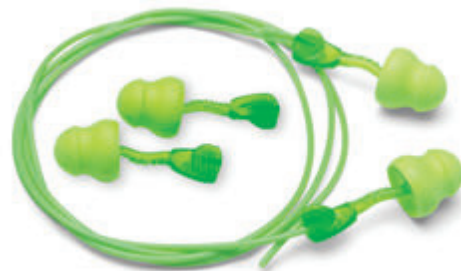
6940 & 6945 Glide Foam Tapones Auditivos Twist In